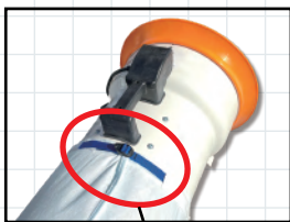
しっかり締められるバンド付き